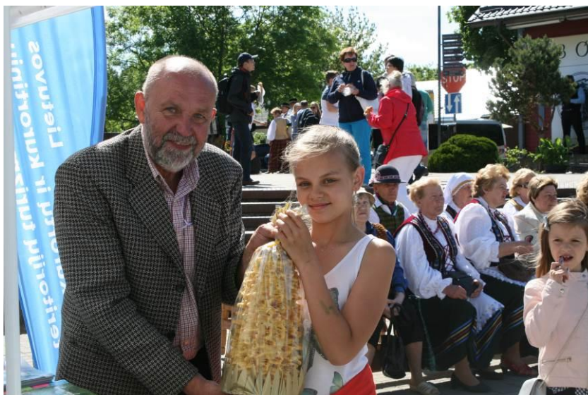
Trakų miesto šventė „Trakų vasara 2017 – nesibaigianti kelionė tavyje, Tėvyne“.

Parengta paraiška įgyvendinat Europos Komisijos projektą EDEN „Patraukliausia Lietuvos kultūrinio turizmo traukos vietovė 2017“ – „Atrask Bitininkystės muziejų naujai!“