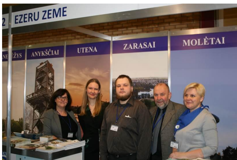
Tarptautinė turizmo paroda „BALTTUR 2017“, Ryga, Latvija