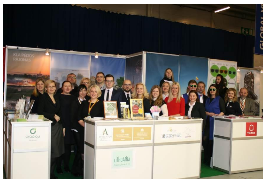
Tarptautinė turizmo paroda „TOURISM 2017“, Talinas, Estija.