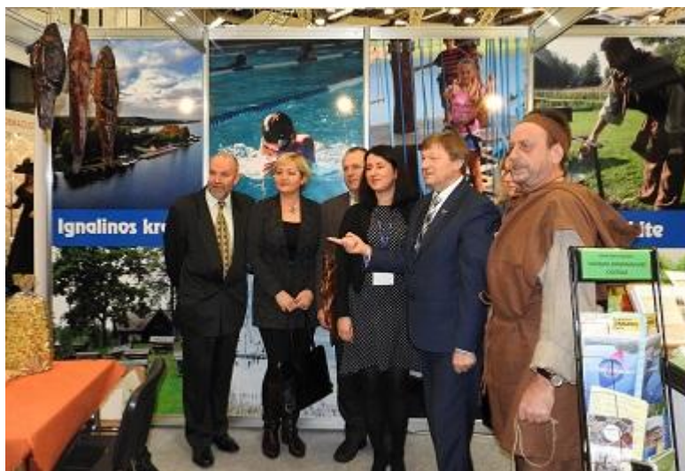
Tarptautinė turizmo mugė „ADVENTUR 2017“, Vilnius, „Litexpo“ parodų centre